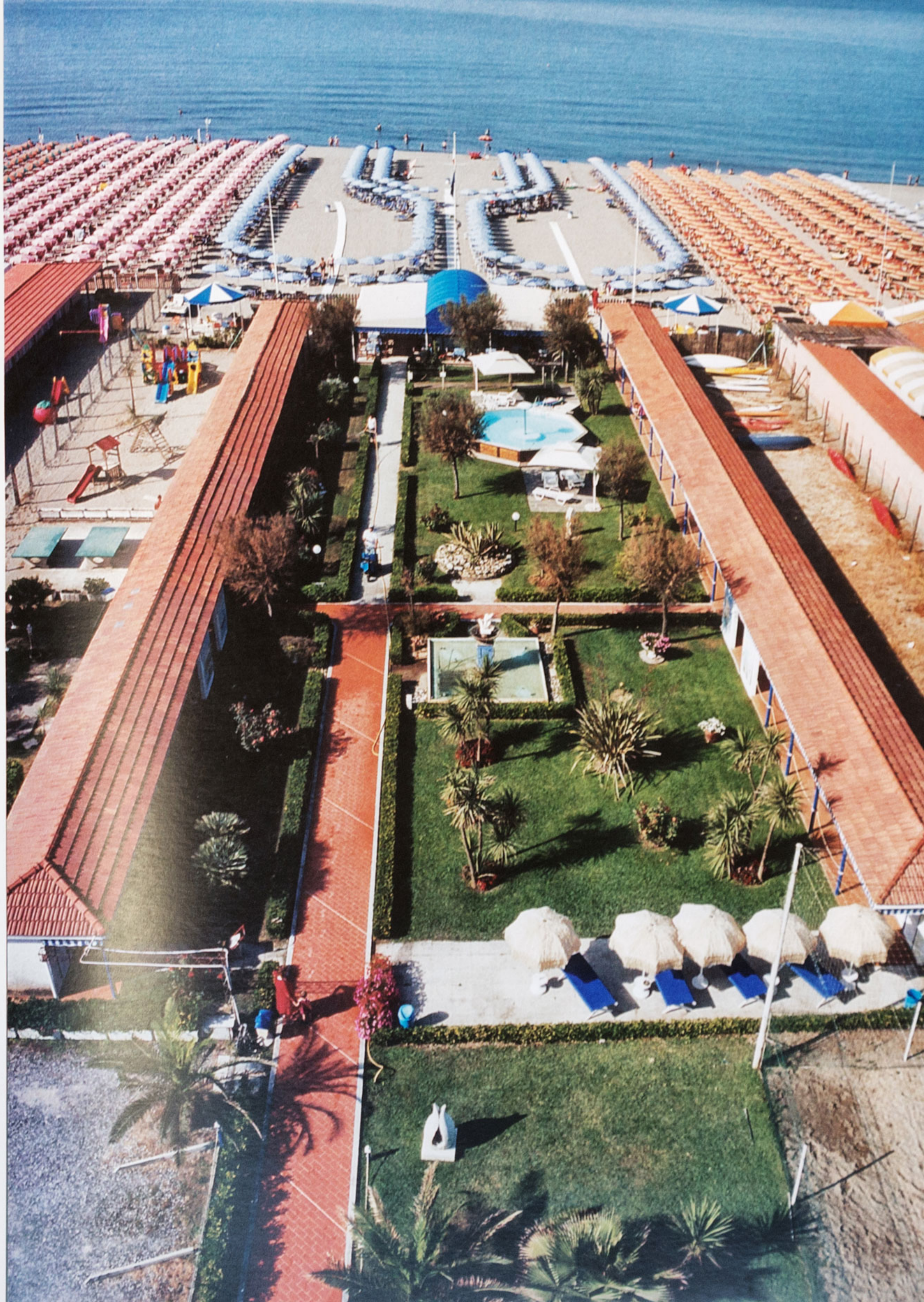
Una panoramica dello storico bagno (a destra) ed alcuni suoi particolari che mettono in rilievo il gusto e la personalità dei proprietari